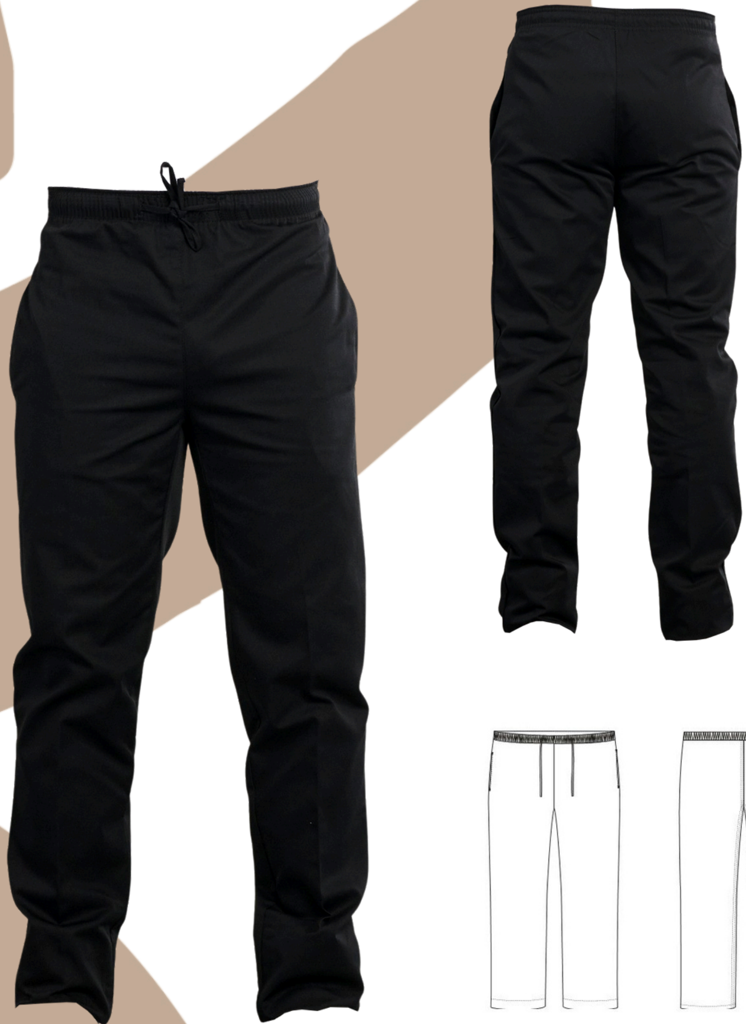
Intérieur bas de jambe