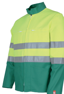
Jaune Fluo/ Alpin 16