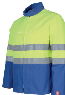
Jaune Fluo/ Bugatti 03