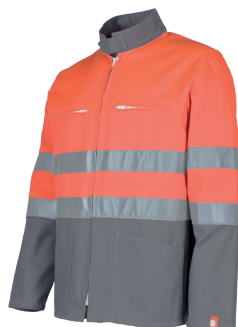
Rouge Fluo/ Gris Acier 201