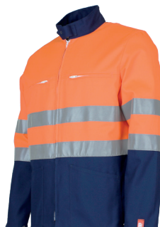
Orange Fluo/ Marine 100