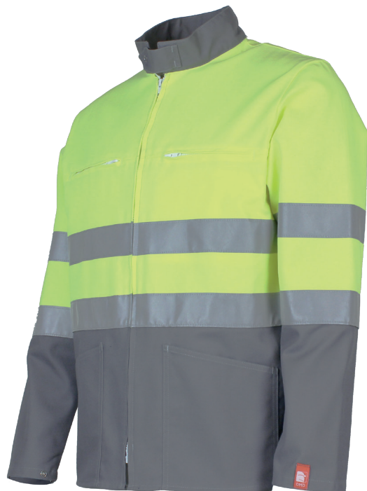
Jaune Fluo/Gris Acier 20