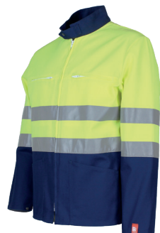
Jaune Fluo/ Marine 02