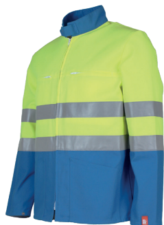
Jaune Fluo/ Azur 13