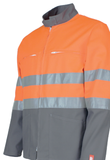
Orange Fluo/ Gris Acier 104