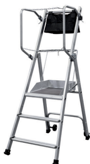
T.REX - 3 MARCHES H. travail maxi : 2,70 m