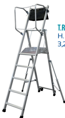
T.REX - 5 MARCHES H. travail maxi : 3,20 m