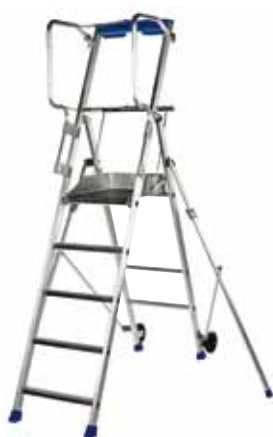
F5 hauteur de travail 3,20 m