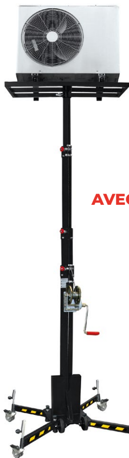
LP125R AVEC PLATEAU AJOURÉ