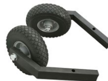
LP-RD-02 Kit roues Ø260 mm pour LP125R