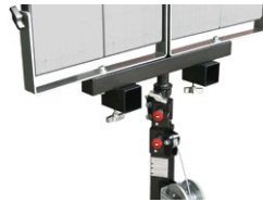
LP-FCA07 Support projecteur double pour LP125, LP125R, LP150 et LP180