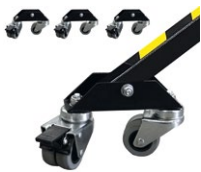
LP-R2-710 Jeu de roulettes pour LP100