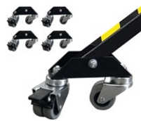
LP-R720 Jeu de roulettes pour LP125 (compris sur le LP125R)