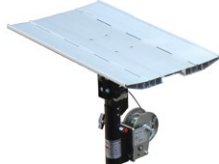
LP-BC05H Grand plateau pliant 750 x 440 mm pour LP85 et LP100