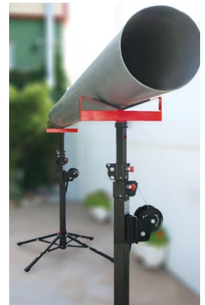
LP-CV10M pour LP125, LP125R, LP150 et LP180