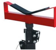
LP-CV10H Support V pour LP85 et LP100