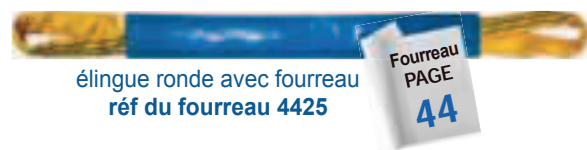
élingue ronde avec fourreau réf du fourreau 4425