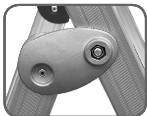
Articulations en aluminium moulé.