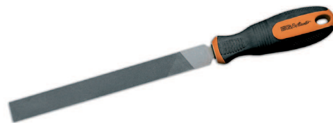
ISO 234/1 ISO 234/2

Angle de coupe conforme à la norme : ISO 234/2 (65° +/- 5%)