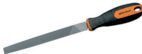
ISO 234/1 ISO 234/2

Angle de coupe conforme à la norme : ISO 234/2 (65° +/- 5%)