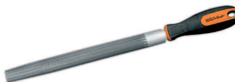
ISO 234/1 ISO 234/2

Angle de coupe conforme à la norme : ISO 234/2 (65° +/- 5%)