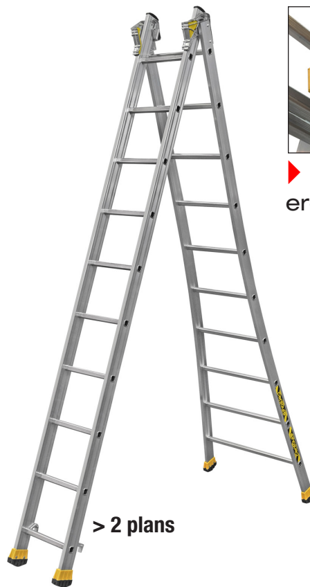
> 2 plans