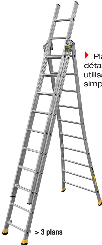
> 3 plans

► Plan supérieur détachable pour une utilisation en échelle simple**