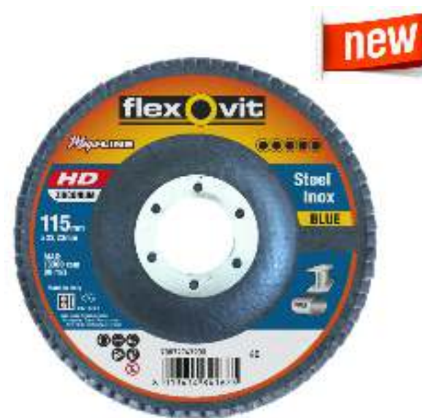
Mega-Line Bleu R860