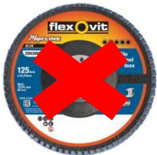
Mega-Line Bleu R828

Les disques Mega-Line Bleu R860 Heavy Duty remplacent les disques Mega-Line Bleu R828 Long life