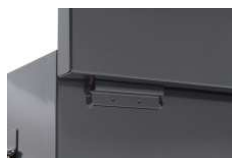
Charnière renforcement avec butée d'ouverture