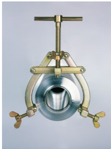
Clamp JA acier

De fabrication Allemande, les clamps JA sont conçus pour ajuster l'alignement des tubes de ½" à 14". Exécution en acier (traité anticorrosion) ou en inox.