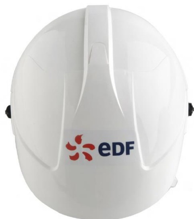
Face écran rentré