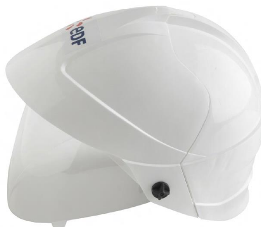
Côté écran baissé