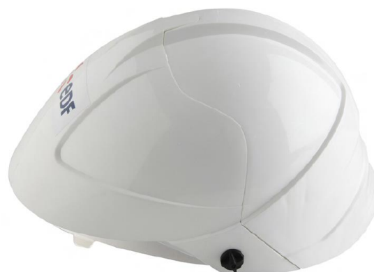
Côté écran rentré