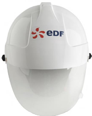
Face écran baissé