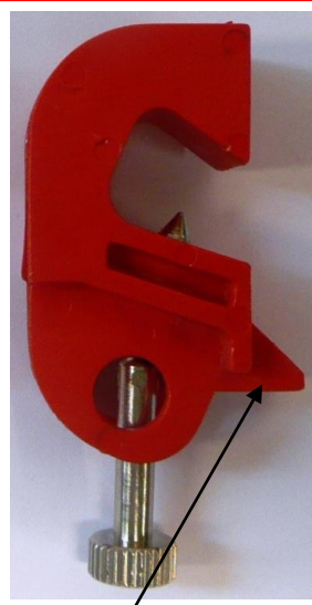
AL-208-C avec languette de maintien adaptée à certains disjoncteurs (C).