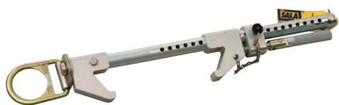
Diagramme des dimensions de l'ancrage pour poutre